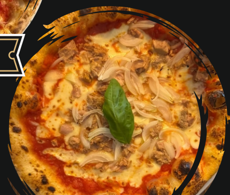
Tonno e Cipolla