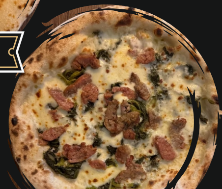
Salsiccia e Friarielli